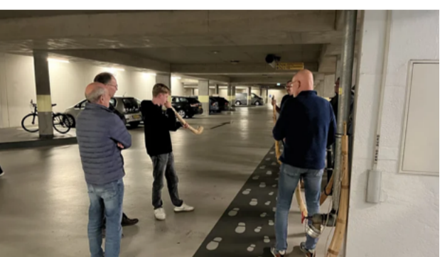
Riessense Midwinterhoornblazers oefenen in de parkeerelder