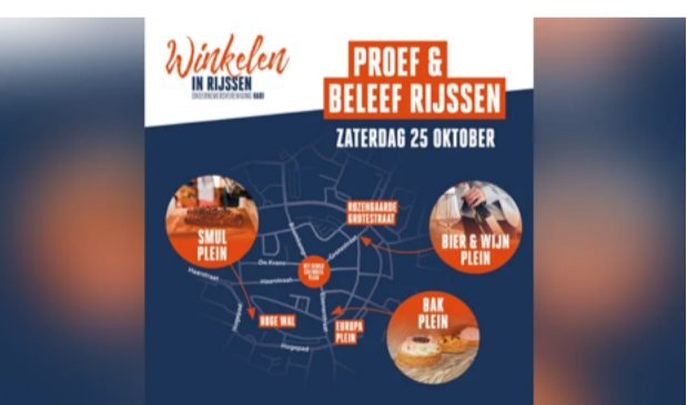
Proef en Beleef Rijssen