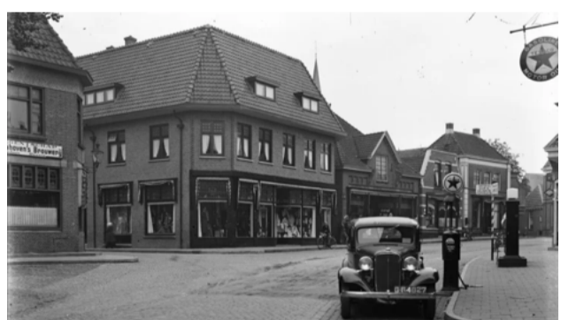
Goed nieuws over de historische hoek Enterstraat-Grotestraat