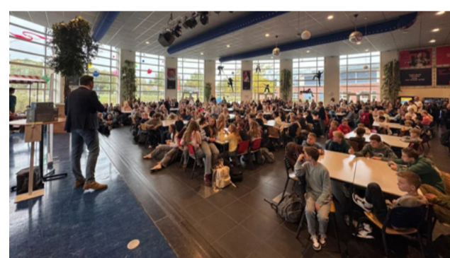
Schoolbreed ontbijt CSG Reggesteyn