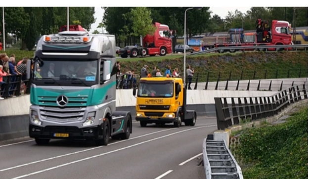
Riessen op de rolwage: een stuk jonge geschiedenis van Rijssen