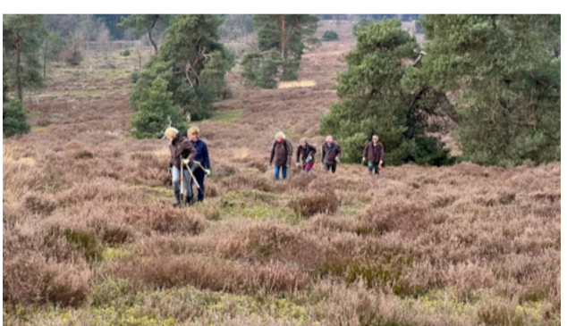
Samen de Holterbergheide op tijdens de Natuurwerkdag